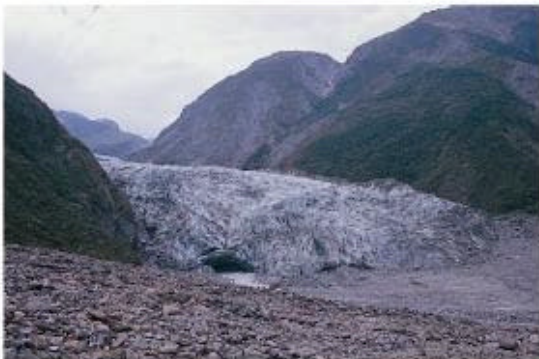
照片4. 1999年的福克斯冰河