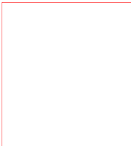
圖三 峽灣地國家公園位置圖

造成峽灣地國家公園獨特地景有三大因素：地體構造持續抬升、冰河作用和古老堅硬的岩石。