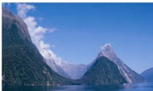
照片8. 米佛峽灣支流冰河槽的U字型谷及米特峰