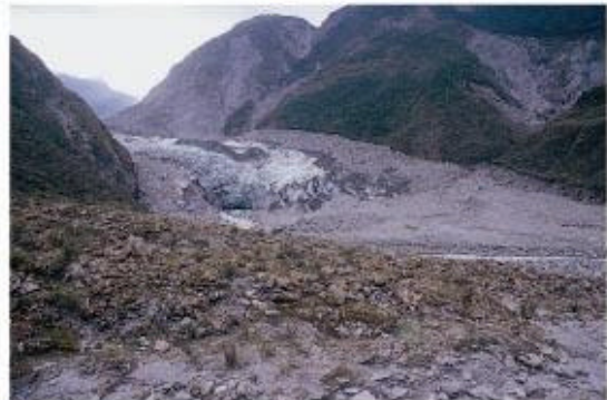
照片5. 2001年福克斯冰河體積大為縮減