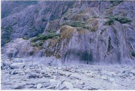
照片1. 冰河槽左側山壁下方的冰河刻蝕的凹槽