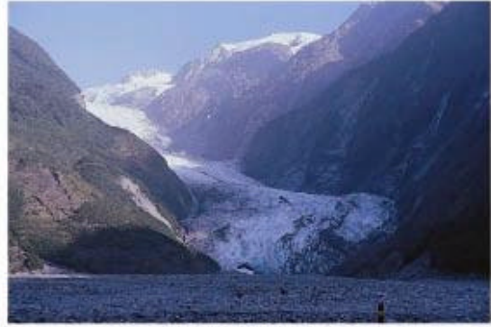
照片2. 1999年弗蘭茲—約瑟夫冰河末端