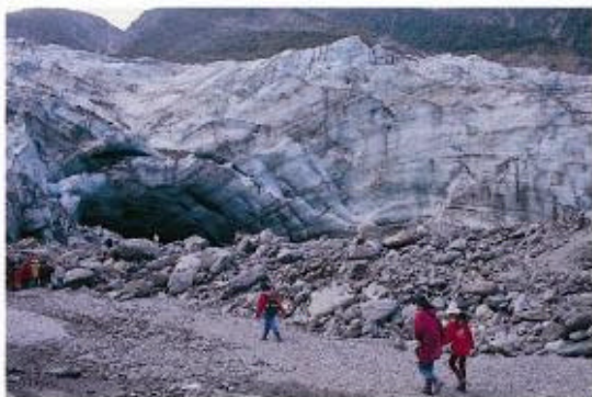
照片6. 1999年冰河末端的冰底隧道