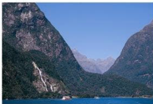
照片9. 米佛峽灣灣頭的U字型谷及懸谷瀑布