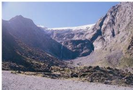
照片7. 荷馬隧道旁的冰斗地形