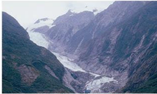
照片3. 2002年弗蘭茲—約瑟夫冰河末端