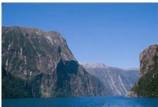
照片10. 世界第八大奇觀的米佛峽灣