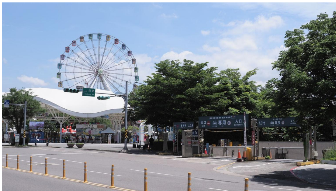
圖二 汽車停車場入口